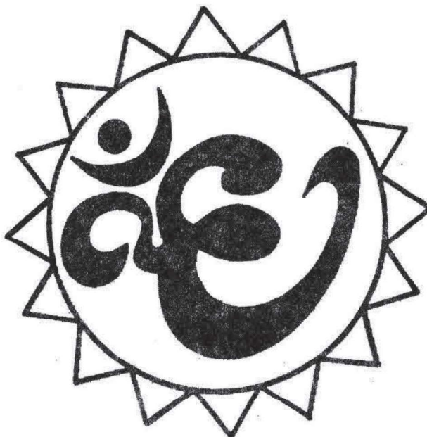
Рисунок для фиксации глаз

Вариант 3. Вокруг знака проведена окружность. Перемещайте свой взгляд по окружности, двигая одновременно глаза и голову. Делайте упражнение вначале с открытыми глазами, затем с закрытыми, представляя окружность.